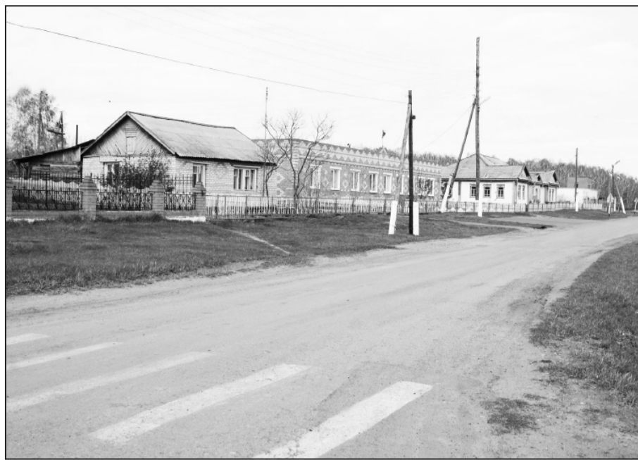
В Огнёво всегда чистота и уют

Аналогичное безобразие творится и около двухэтажного дома. Здесь, видимо, порядок не наводился несколько лет: кусты засохли, их ветки сплелись между собой, везде мусор. Как же так? Неужели жители этого дома не хотят, что-