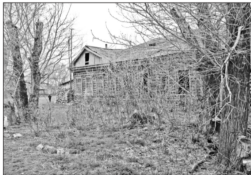
Тот самый «парк» в селе Б.Ярки, в котором никогда нет порядка