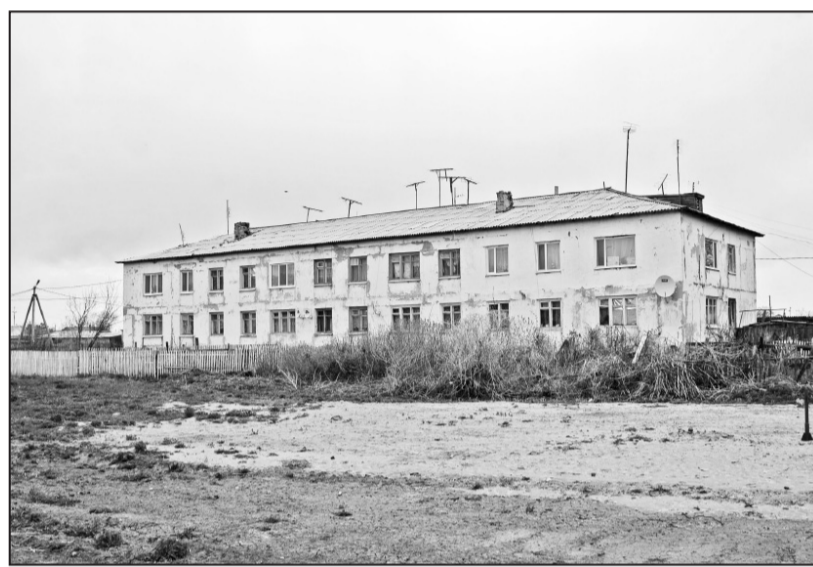
Жители двухэтажного дома «забыли» убрать мусор

бы их территория была чистой и аккуратной?