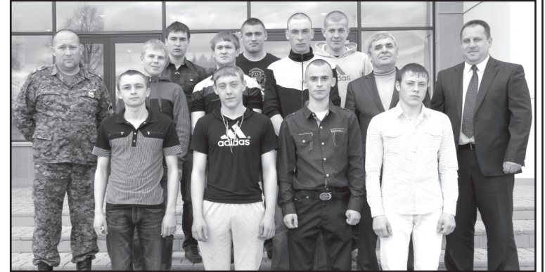
Перед началом мероприятия фотография на память