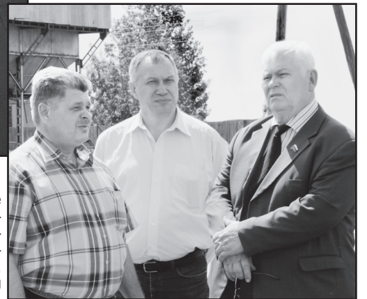
В ООО «Земля»

– О Вашей семье, если можно. Вторая половина совпадает с Вами по характеру, по душе?