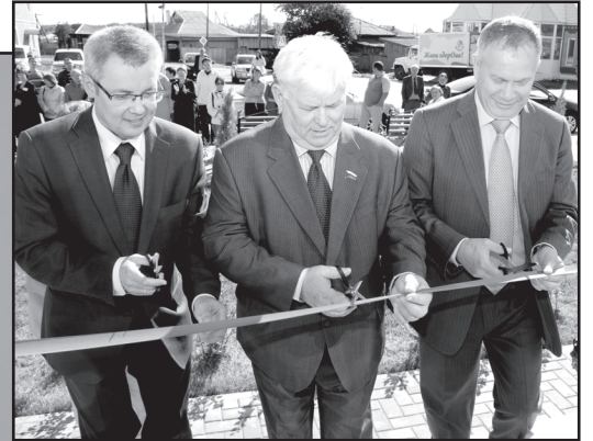
Открытие Дома прессы

– Успокаивает и придаёт сил труд на земле.