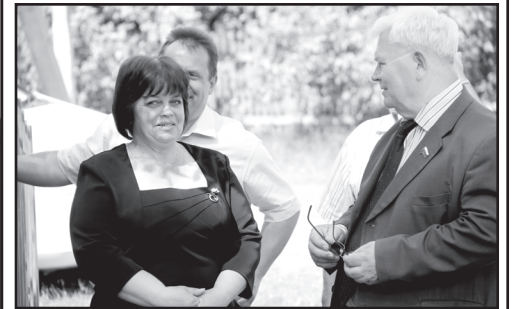
В Володинской школе