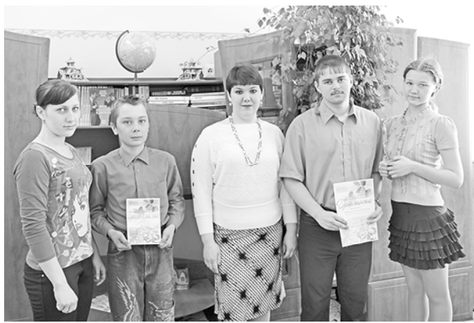
* Творческая группа экологического проекта

Весенний период — самое яркое доказательство того, как загрязняется природа во время зимы. После таяния снега на улицах, возле дворов можно увидеть много разного мусора. Бумага, стеклянные и пластиковые бутылки, упаковки, окурки... Что только не разбросано по деревням и сёлам! Виновником такого безобразия является человек.