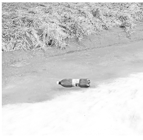
* С этим борются ребята...

— У нас нет заводов, загрязняющих атмосферу, мало автотранспорта, а главным врагом природы является человек. И если этот человек ещё и