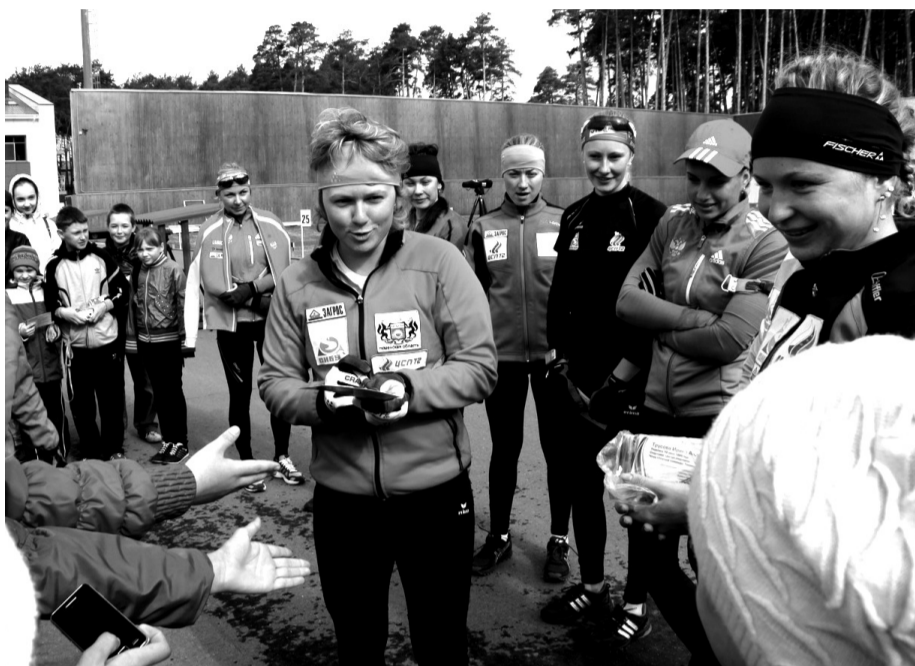
• Автографы от чемпионов.

В эти дни в «Сосновом бору» тренируется сборная области по биатлону. В плотном графике занятий спортсмены нашли время и показали мастер-класс для тех, кто только-только встал на лыжи и взял в руки винтовку.