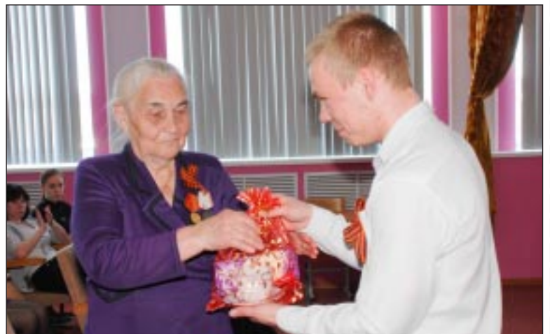
Каждому ветерану был вручен подарок.