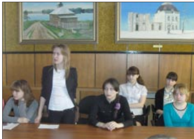
Восьмиклассники читают стихи поэтов-фронтовиков.

Накануне 9 Мая районный краеведческий музей «Легенды седого Иртыша» пригласил учащихся восьмых классов Уватской школы в литературную гостиную. Состоялся разговор о русской литературе периода Великой Отечественной войны, когда главными стали тема войны и тема Родины.