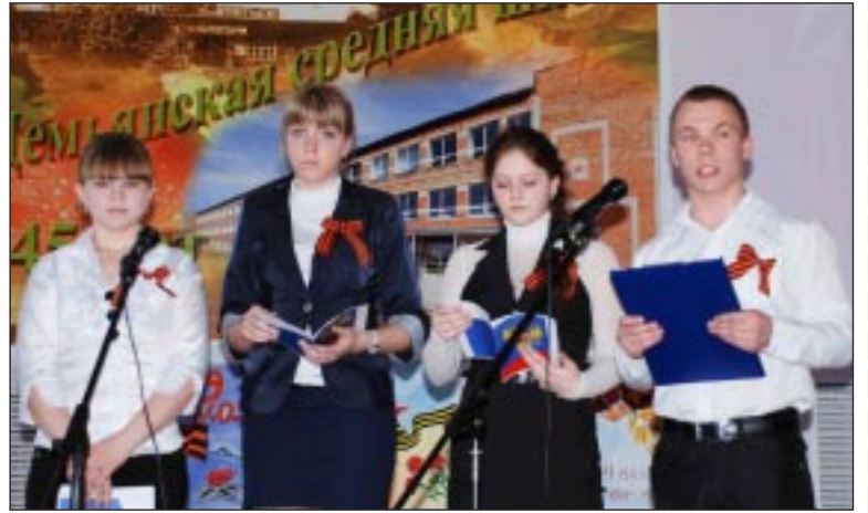
Десятиклассники рассказывают о своих дедушках и бабушках.

Проходят десятилетия, мелькают годы, но мы всегда будем помнить земляков, воевавших на фронтах Великой Отечественной, и тех, кто самоотверженно трудился в тылу.