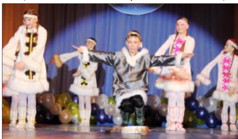
Яркий подарок гостям фестиваля - танец «Сказы Севера».

Фестиваль «Тюменская пресса», проходящий на Уватской земле, не мог обойти вниманием и жемчужину Сибири - Тобольск: первую половину дня гости праздника провели в этом древнем городе, познакомились с его достопримечательностями, принимали участие в открытии сквера «Тобольской правды» - старейшей газеты региона, которой в про-