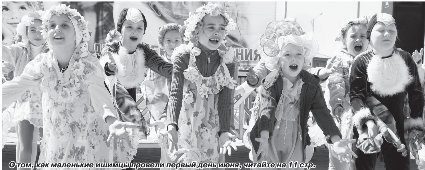
© том, как маленькие ишимцы провели первый день июня, читайте на 11 стр.