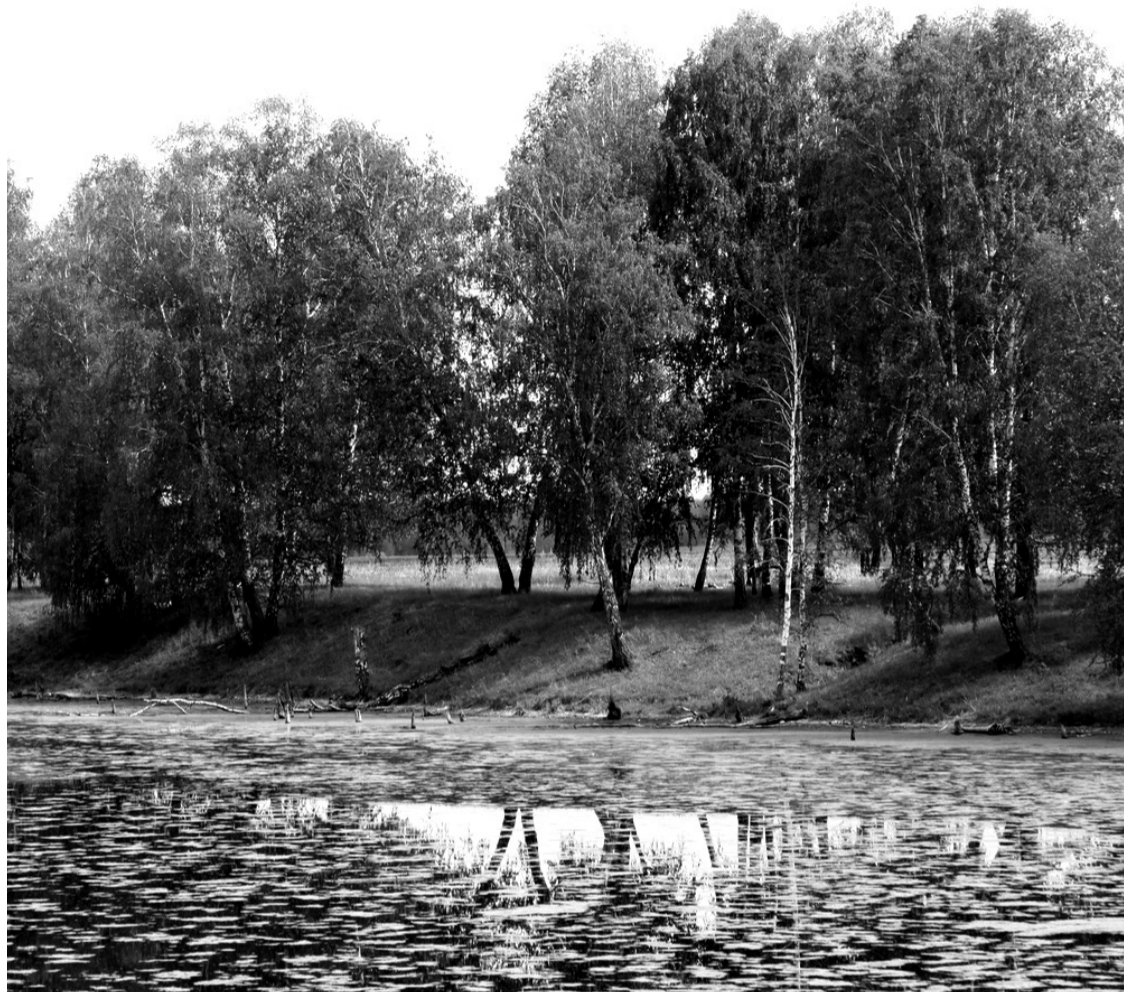
• Дремлет пруд у Сосновки.

Если начать с терминологии, то экология – это всё-таки наука о взаимодействии живых организмов (в том числе и людей) между собой и с окружающей средой. Поэтому не экология у нас плохая (как может быть плохой наука?), а среда окружающая зачастую оставляет желать лучшего.