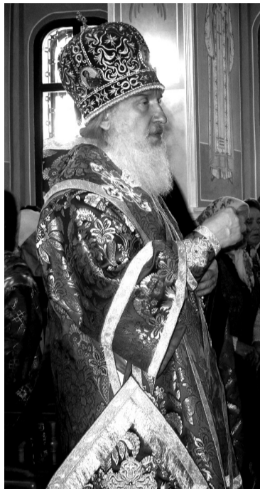
• Наставление владыки на доброе дело.

Говорили о Слове, что питает души человеческие, укрепляет