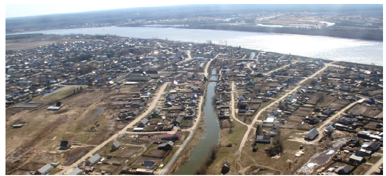
Село Уват с высоты птичьего полета. Журналисты на вертолете отправляются на нефтяные месторождения