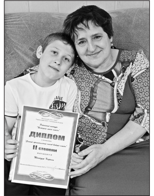
Первый внук – радость и гордость бабушки

А вот в числе призёров были и дети. Например, на втором месте за рассказ о «Самом оригинальном