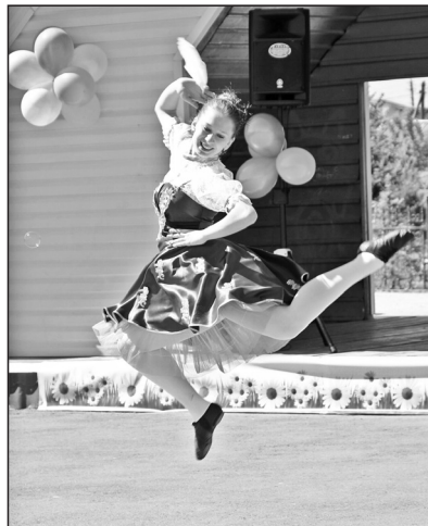
Лето начинается танцем

жет, детям раздавать будут...» Тем не менее, каковы бы ни были возможности взрослых, они постарались угодить в этот день своим малышам по максимуму. Ведь детство не повторяется.