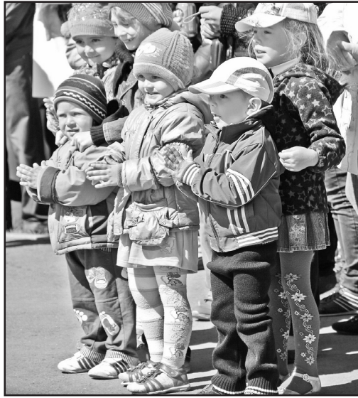
Вместе путешествуем в страну Вообразию

сопровождении близких, родных и любимых осваивала аттракционы, толпилась в очереди за сладкой ватой и фотографировалась у фонтана. После поздравительных выступлений серьезных тетенек и дяденек с парковых подмостков грянул настоящий фейерверк ребячьих талантов, а среди собравшейся публики – долгие несмолкающие аплодисменты. Поскольку детки, как известно, не мерзнут, покинуть парк раньше, чем через несколько часов, у озябших взрослых возможности не было. Не отпускали соскучившихся по такому масштабу веселья ребят вожденный батут, «пираты» с приготовленными кладами, «веселые старты» и мыльные пузыри. Для детей праздник удался на славу, да. Но мамы, папы и бабушки с огорчением вынуждены были вновь ощутить горький привкус подобных мероприятий в виде не подетски взвинченных цен на немудреные ребячьи хотения – от стакана газировки до надувных шариков. Одна бабушка на последние деньги осчастливив внуков «такими же, как у вон тех ребят» игрушками, вздохнула: «Мы-то думали, коли праздник детский, то подарки, быть мо-