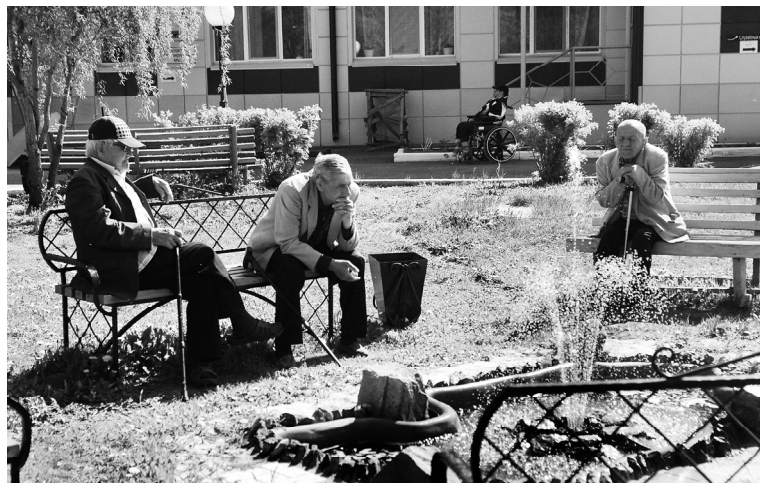
Проживающие Вагайского дома-интерната на прогулке