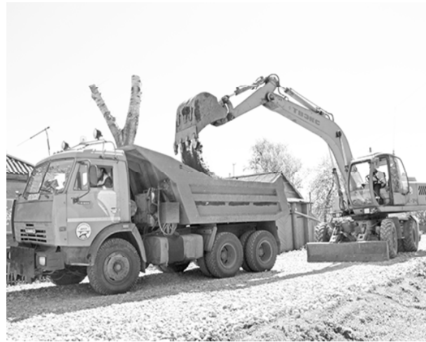
* Ремонт улицы Димитрова, с. Сладково