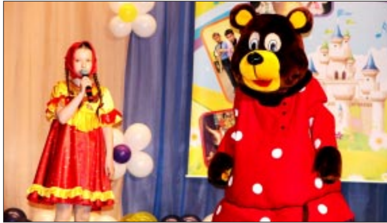
Маша и Медведь - ведущие фестиваля.

Среди вокальных групп заявки на участие в фестивале подали лишь два дуэта, занимающиеся в музыкальной студии Туртасской школы под руко-