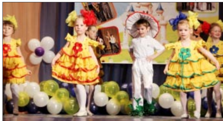
Танцевальный коллектив «Ромашка».