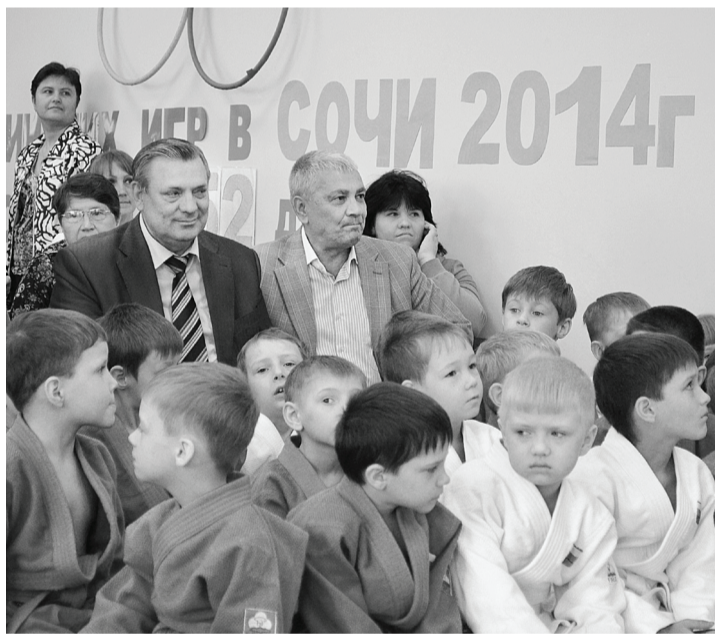
На турнире, посвящённом Дню защиты детей.

А призёры турнира с удовольствием показывали роди-