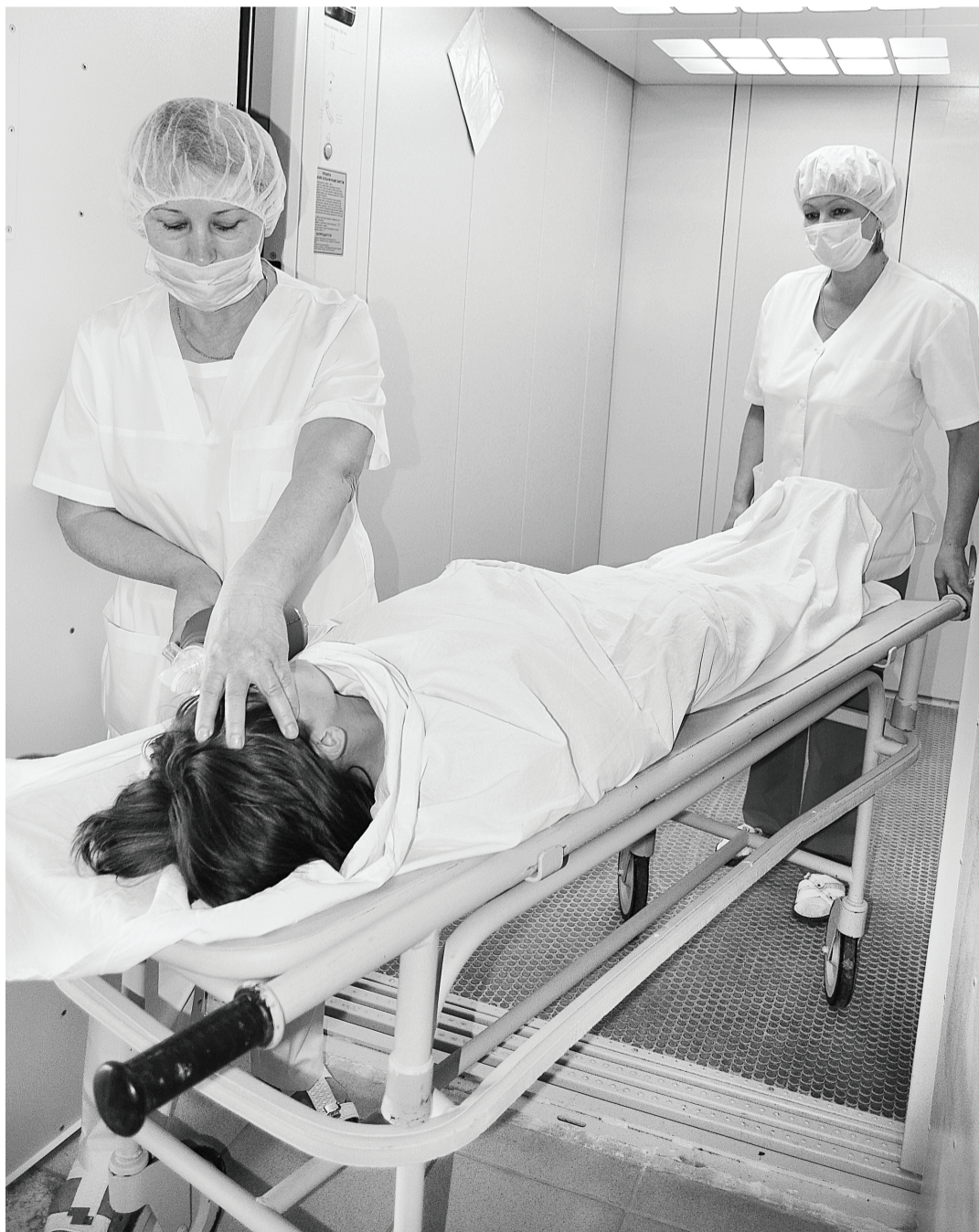
Современное средство транспортировки больного, техническое оборудование, грамотный, профессионально обученный персонал обеспечат оперативность при госпитализации и экстренную помощь. 21. 12. 2012 года в областной больнице №15 (Нижняя Тавда) начал функционировать грузовой лифт. Первый в районе! Как это облегчило труд медперсонала, переоценить сложно.