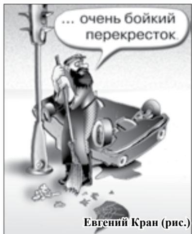
Евгений КРАН (рис.)