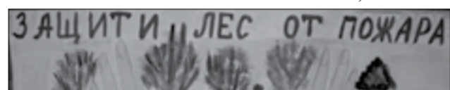
Настя КОТЛОВА, 5 кл., школа № 1

Об этом я рассказала в лагере в отряде, потому что мы должны охранять природу, беречь лес от пожаров.