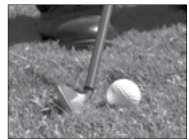
Дарья ФЕДОТОВА (по материалам сайта nonpareilonline.com)

Известный игрок в гольф страдал от болезни Альцгеймера, поэтому собранные средства пойдут на помощь людям, которые борются с этим недугом.