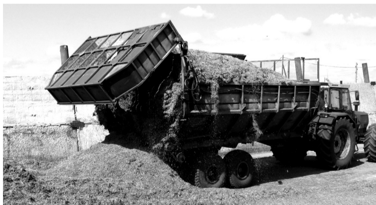
• Зелёная масса люцерны готова к трамбовке.