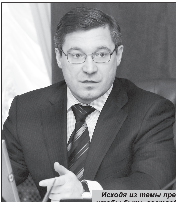
Губернатор Тюменской области В.В. Якушев

Первым мы адресовали губернатору вопрос общего звучания: при каких качественных характеристиках состоится инвестиционная привлекательность муниципального образования. И как, в связи с этим, выглядит Голышмановский район, куда журналисты приглашены? Среди всех факторов Владимир Владимирович Якушев на первое место поставил активность муниципальной власти, желание работать, искать точки роста, реализовать базовые начала. А потом уже транспортная инфраструктура, природные и людские ресурсы. Что касается Голышмановского муниципального района, здесь, по оценке губернатора, хороший инвестиционный климат. Плюс исторически сложилось, что крупные промышленные предприятия