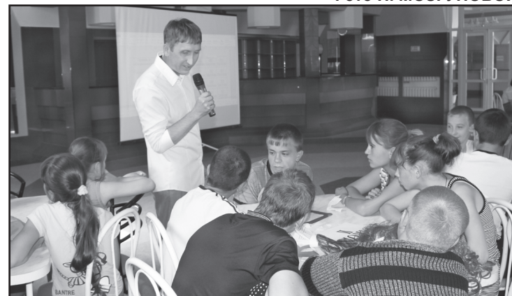
Районный конкурс-викторина «Я знаю закон»