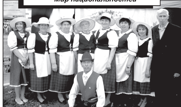
На областном фестивале национально-художественного творчества