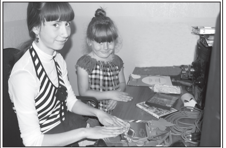
В Лесновской средней школе