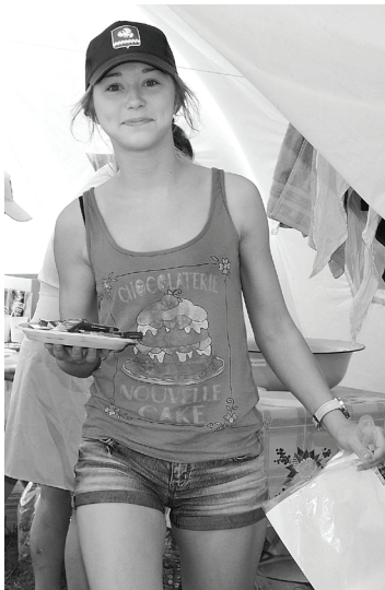
Обед на свежем воздухе. Что может быть полезнее и вкуснее?

Пора уже и с командой добровольцев знакомиться. Напом-