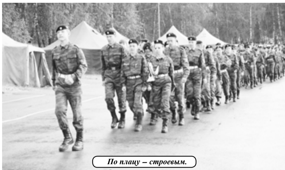
По плацу – строевым.

и привычного порядка, у ребят хватит надолго. Многие из них желают попасть на вторую подобную смену, которая откроется одиннадцатого июля. Путёвок на неё выделено столько же, как и на первую. Кстати, финансирование профильных смен осуществляется департаментом по спорту и