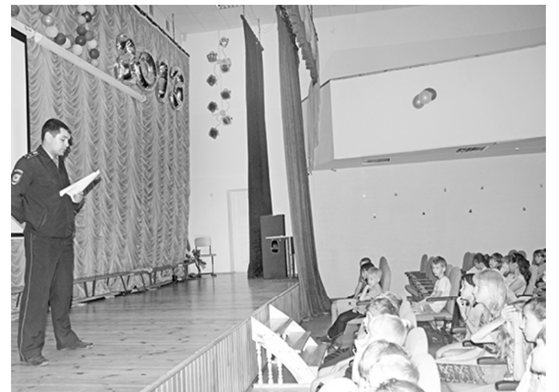
* Во время беседы