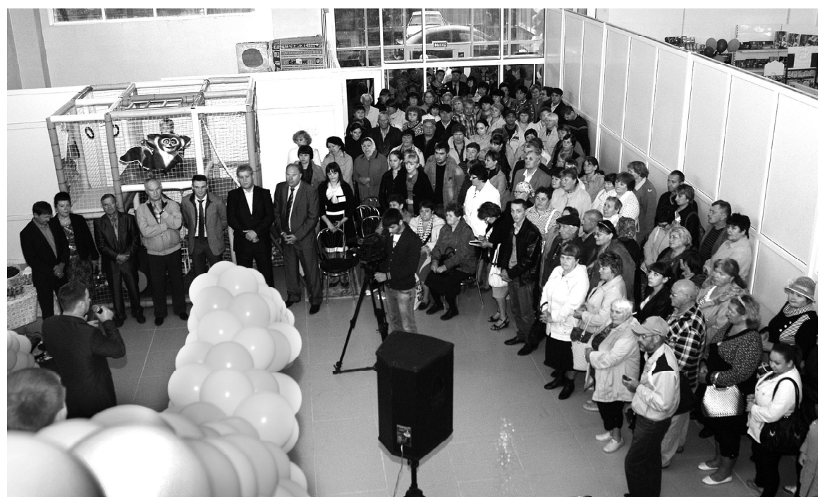
Торжественное открытие торгового дома «Красноярский»