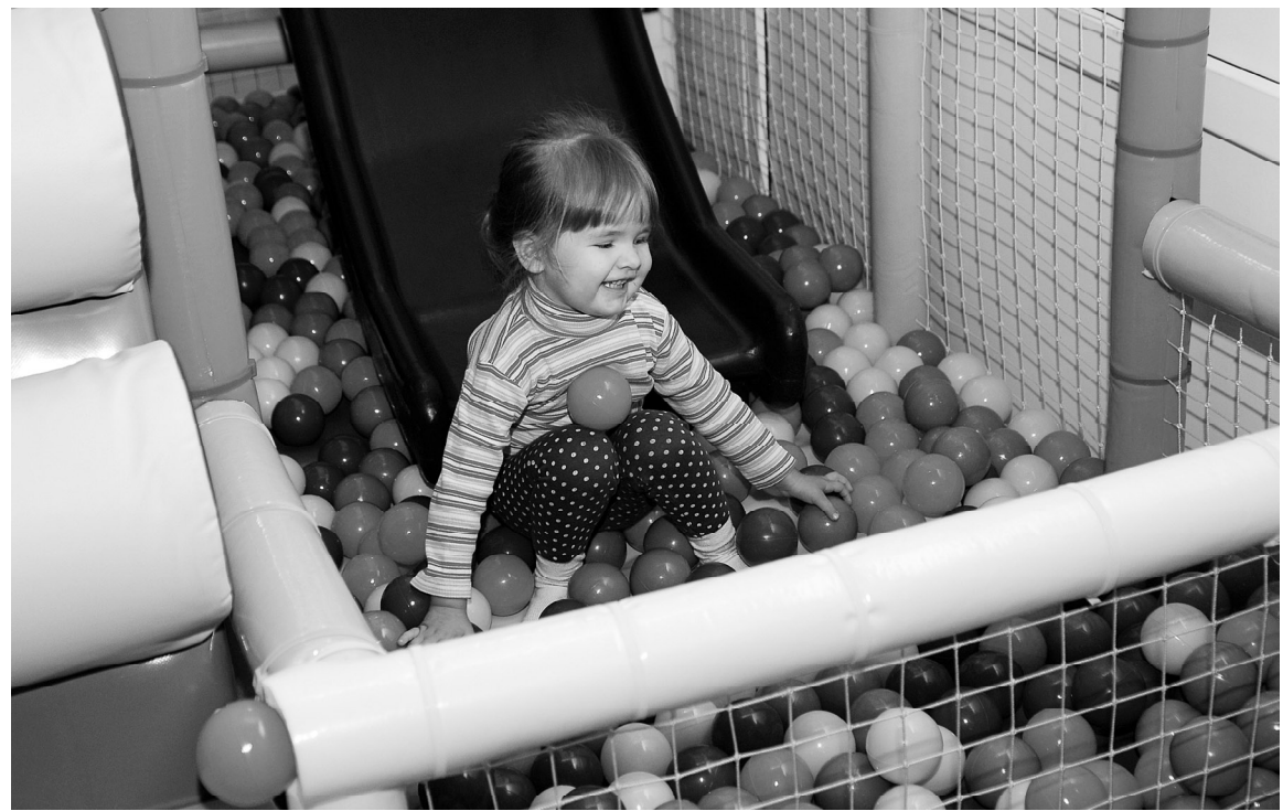
Игровая зона для детей