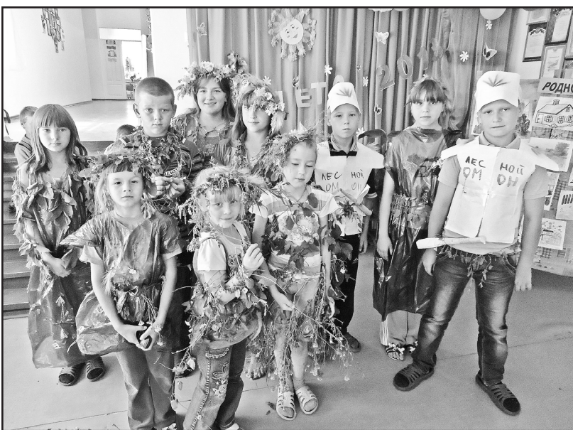
В лагере ребятам было весело

На базе Казанской коррекционной школы с 1 по 20 июля работал летний оздоровительный лагерь «Республика детства». Участники смены – жители городов «Солнышко» и «Парус». Вместе они разработали Конституцию республики, кодекс чести, календарь республики. Каждый город имел свой герб и гимн, жители этих городов постоянно соревнуются между собой в ловкости, мастерстве и творчестве. Каждый день жизни лагеря проходил под определённым девизом и эмоциональным настроением. Например, в один день выбирали качество человека «дружелюбие». Жители городов в тече-