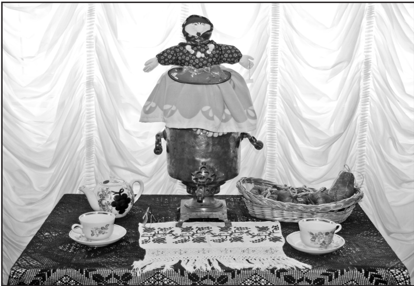
Самоварная кукла всегда украшала чайный стол

ные посетители разглядели и нефтяные вышки, и рыбные озёра, и зелень бескрайних лесов, и золото спелых нив. Не уступают по красоте ковры «Русская деревня», «Мои мысли, мои скакуны». И всё же ярче всех горел ковёр «Рождество», или «Радость», как окрестили его восхищённые посетители. Он просто-таки полыхал всеми оттенками красного цвета. От него трудно отвести взор.