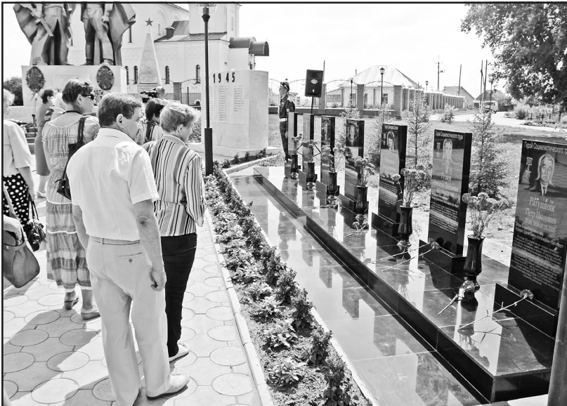
Долг каждого гражданина страны – помнить своих героев

Двадцать восьмое июля, светлый воскресный день. Несмотря на жару и выходные заботы, к трём часам дня у памятника Солдату и Матросу в центре села Казанского собрались десятки людей со всего района. В этот поистине исторический день произошло небольшое, но замечательное и знаковое событие – торжественное открытие Аллеи Славы Героев Советского Союза.