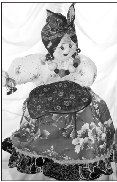
Одна из лучших кукол выставки

И ещё об одном чуде стоит сказать. На стенах музея развешены лоскутные ковры небывалой красоты. Вот ковёр с гербом Тюменской области. По его краям загадочные узоры, на которых многочислен-