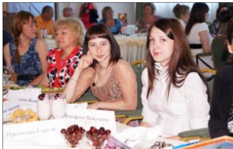
На встрече с главой района.

опыт поможет вам и в дальнейшем строить вашу жизнь в пользу добра, порядочности, успешности и профессионализма. Убедена, что мы еще не раз будем гордиться вашими успехами в жизни, как гордились школы вашими достижениями за эти 11 лет! В добрый путь!»