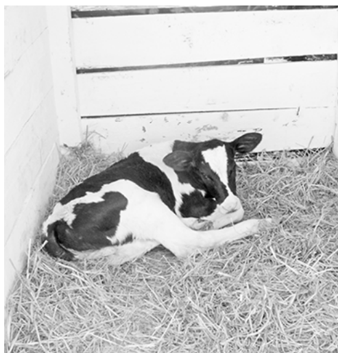
* Малыши на свежем воздухе