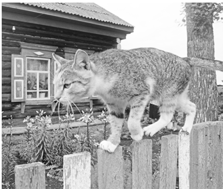
* «А я иду такая вся...»