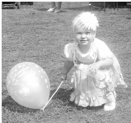
* «Мне на празднике весело...»