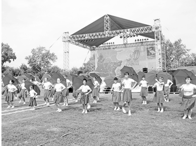
* Открытие концертной программы