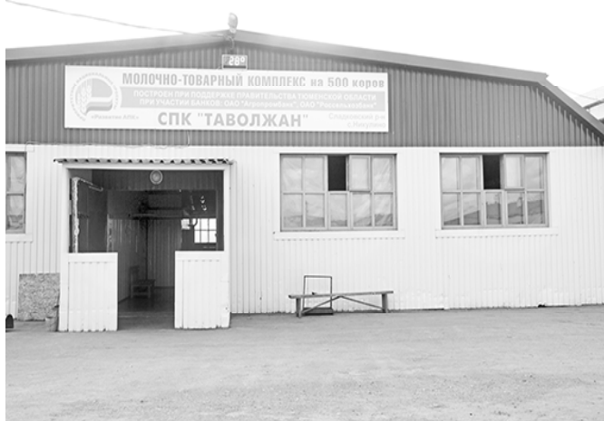
* Основное помещение комплекса