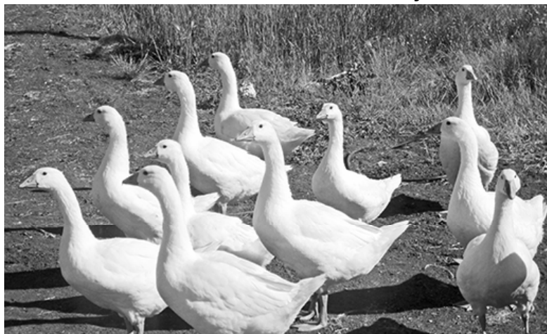
* Весёлая семейка.