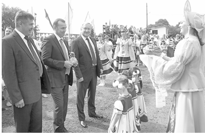
* Хлеб-соль дорогим гостям праздника

Славный юбилей отметил сладковский край: ему исполнилось девяносто лет. Почти век живёт наша родная земля. Приумножает свои богатства, рождает детей, создаёт молодые семьи. И гордится всем, что есть в районе. А самое главное – людьми. Трудолюбивыми, гостеприимными, радушными. Теми, кто строит будущее нашей малой родины и прославляет её.