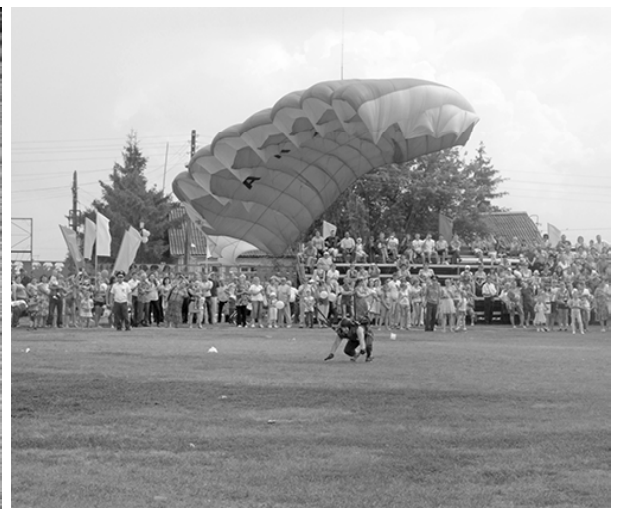
* Парашютный десант