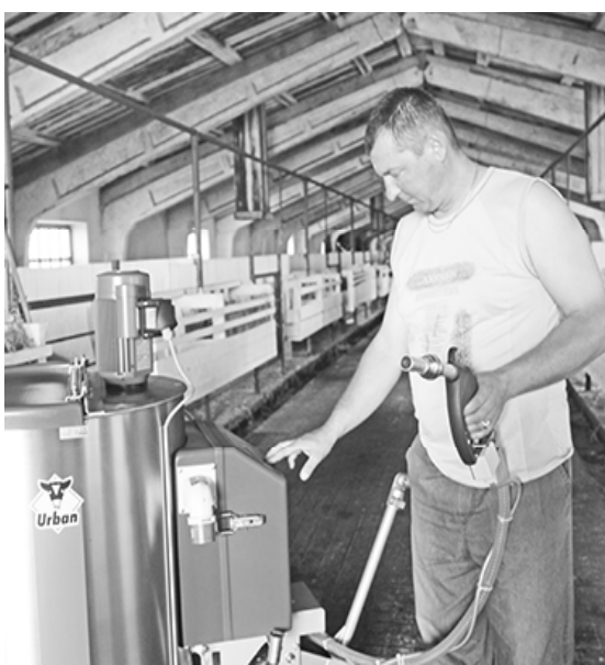
* Демонстрация «Шатла»