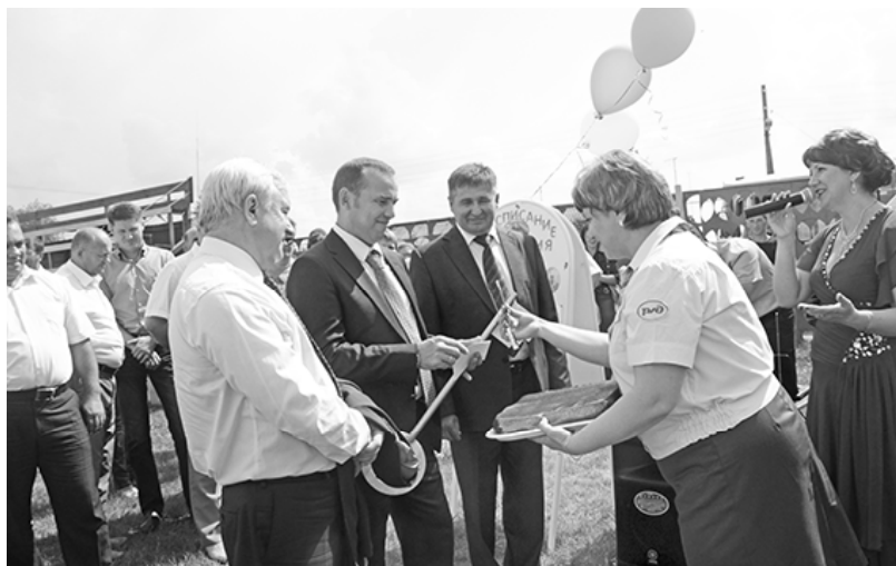
* Подарок от маслянцев