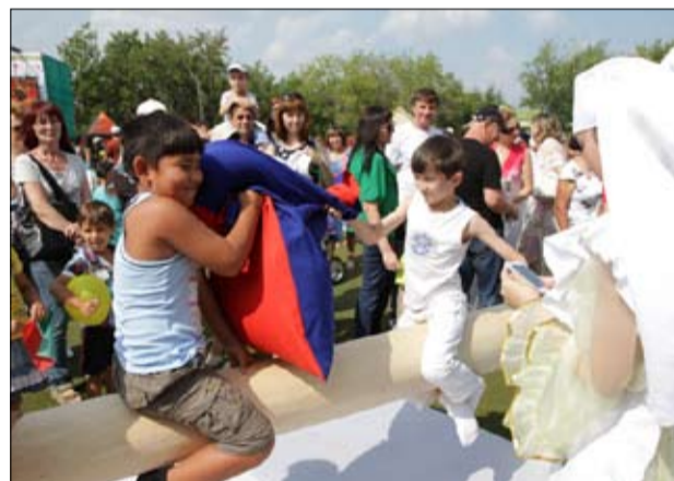
А ну-ка удержись!