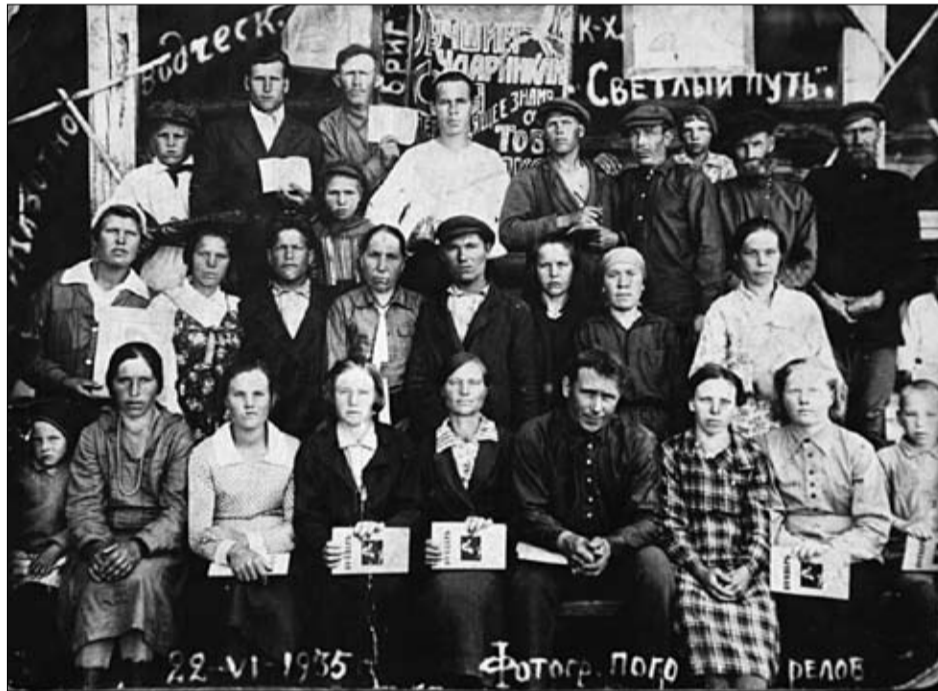
1935 г. В руках у многих колхозников буквари, которыми награждали тех, кто хорошо работал

В 50-х годах на базе мелких колхозов (тогда ещё Тоболтуринского сельсовета Байкаловского района) был организован укрупнённый колхоз имени Фрунзе с хозяйственным центром в Тоболтуре (протокол № 4 от 24.01.1951 г. Байкаловского РИК). Через десять лет его переименовали в «Светлый путь». Председателем стал