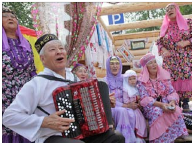
Льётся песня сибирских татар

Каждый эпизод этого жизнерадостного сценического действия - танцы, игра-ца, элементы поклонения земле, трудовые картинки - в полной мере представил