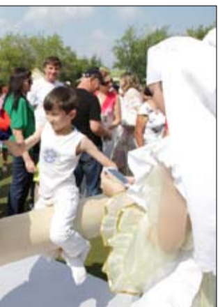
А ну-ка удержись!

Пробыв на праздничном майдане больше трёх часов, мы обошли его несколько раз - от шатров до