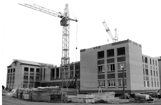
Строится школа в райцентре