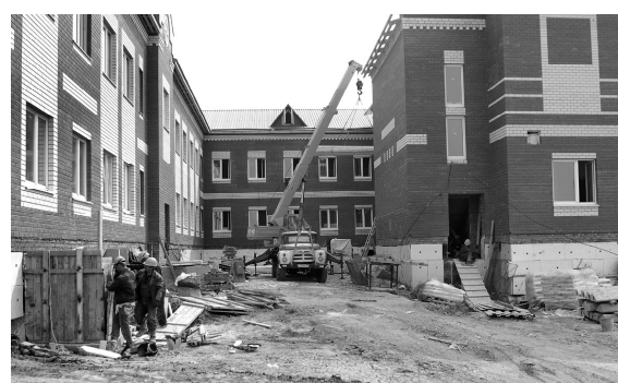
Самая высокая степень готовности у школы, что возводится в Вагае