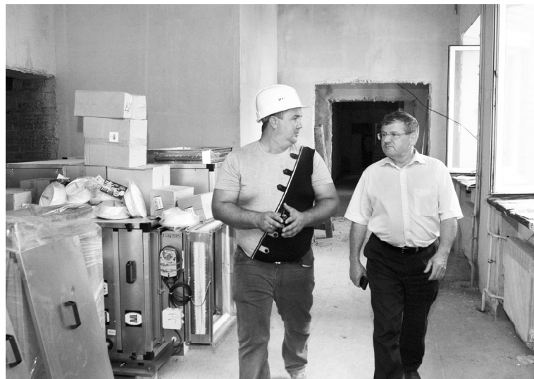
В Вагайской школе