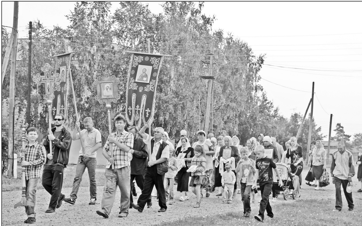
Крестный ход собрал ильинцев и гостей