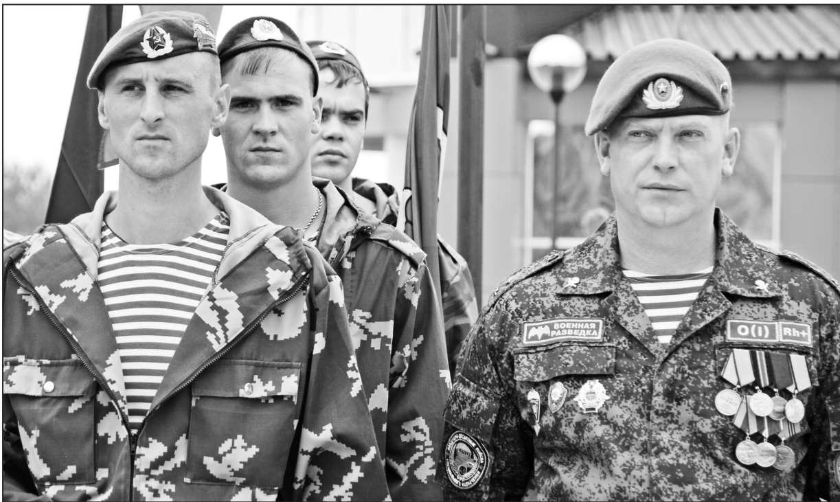
Наши десантники лучше всех!