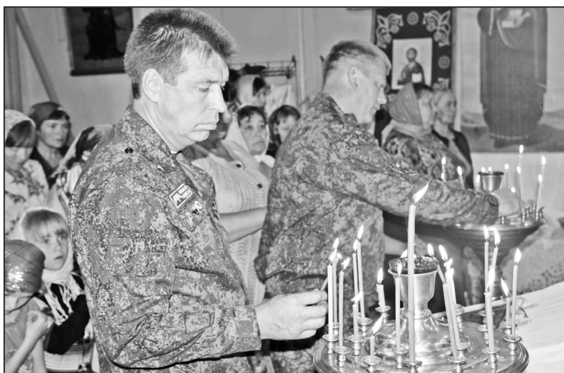
Илья-пророк, помолись о воинах русских!