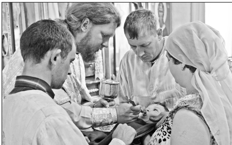
«Пустите детей приходить ко Мне...»

После совершения Таинства Причастия, под неустанный колокольный звон на всё село, верующие под сенью хоругвей и с иконами в руках выдвинулись с крестным ходом по ильинским улицам. Остановку сделали в больнице, где батюшкой были окроплены святой водой палаты, страждущие и медперсонал. Как оказалось, в больнице обустроена уютнейшая моленная комната – ведь поддержание телесных сил немислимо без духовного выздоровления. По возвращении в храм и завершении богослужения собравшиеся были приглашены за хлебосольный стол – ильинские сестры и братья очень гостеприимны. Праздник удался, и все в благодатном расположении духа отправились по домам.