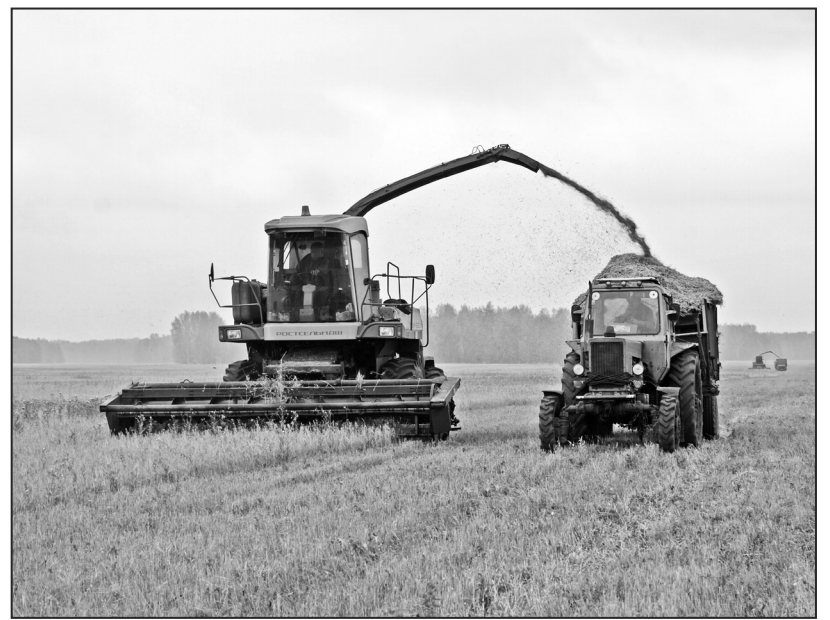
Заготовка сенажа идёт чётко