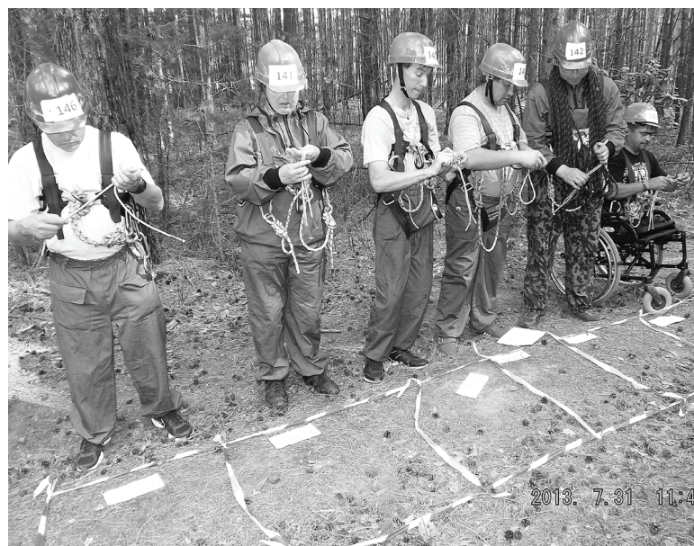
Команда «Синяя птица» на трассе «Пешеходная».