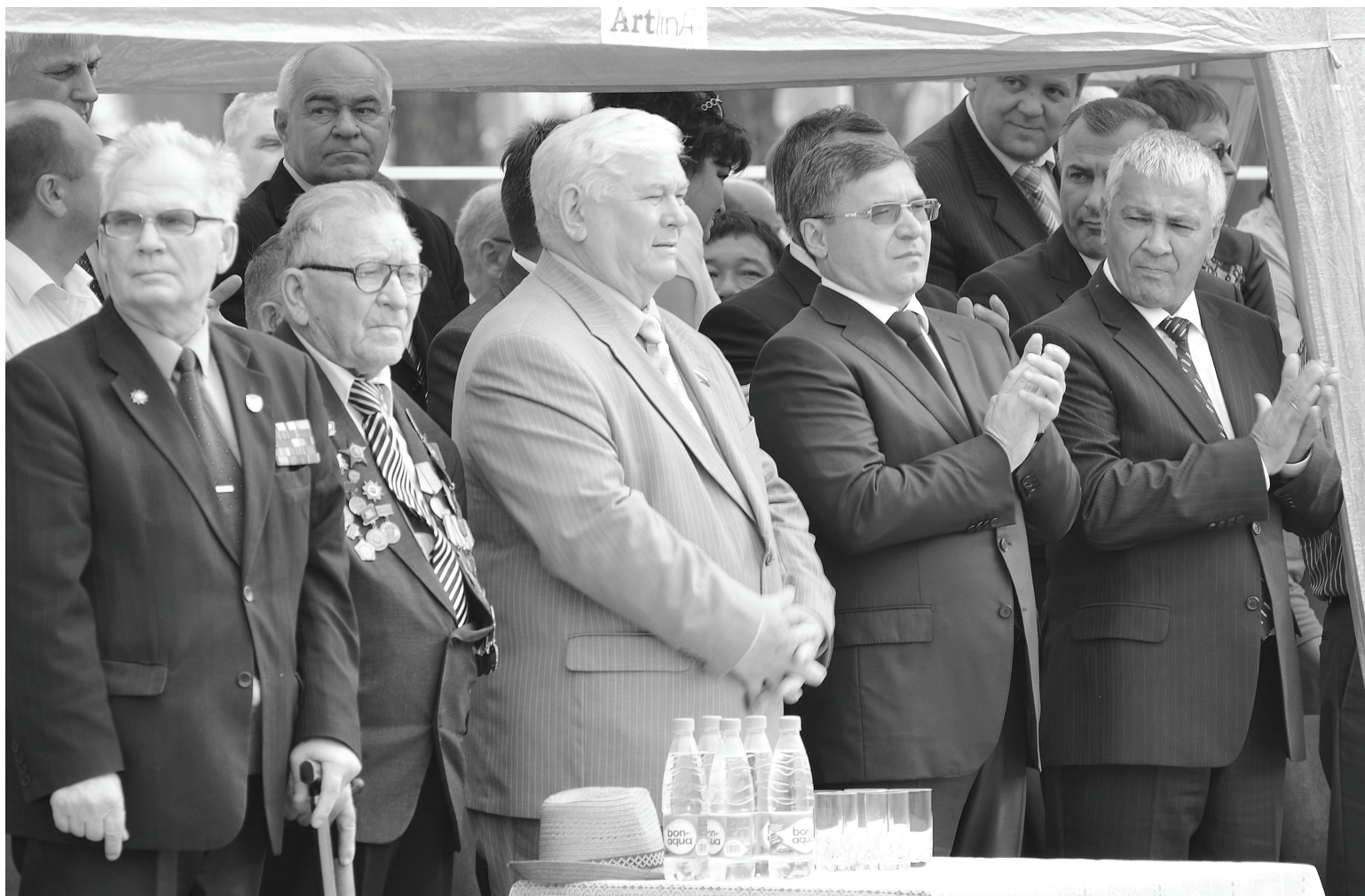
Среди почётных гостей губернатор Тюменской области В.Якушев и депутат областной Думы Ю.Конов.