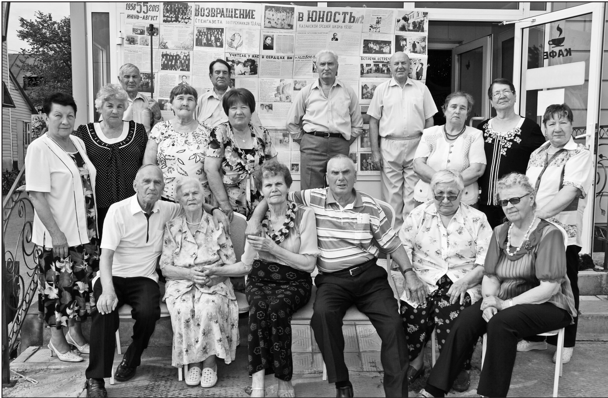
Фото на память о встрече

Быстротечно, безжалостно время, его ни на миг не остановишь. Давно ли, кажется, выпускники 10 «а» класса 1958 года Казанской средней школы встречали пятидесятилетие со дня своего выпуска, и вот опять прошло-пролетело с тех пор пять лет. Верные школьному уговору бывшие десятиклассники, а теперь уже солидные пенсионеры собрались у крыльца родной школы. Перед этим они съездили на кладбище, к могилам своих учителей-наставников. Почти все помнят тех, кто давал им знания, кто вкладывал в них душу, наставлял. Теперь-то уж явно видно, что воспитание не прошло даром. Выросли из них чистые душой и помыслами люди, прекрасные труженики, любящие свою малую родину.