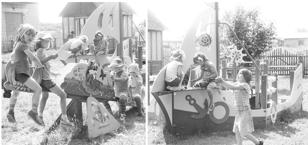
* На качелях