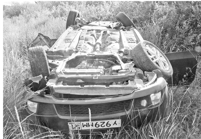
* Выжить удалось не всем

Анастасия ГАЦАЕВА