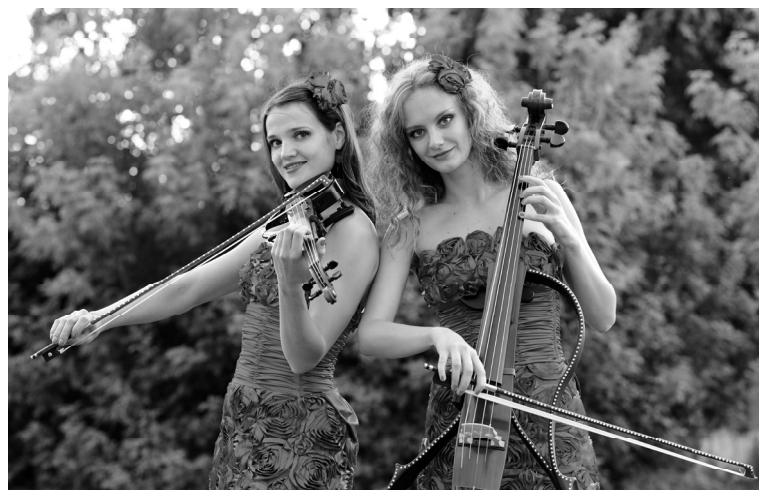
PrimaVera: успех и обаяние