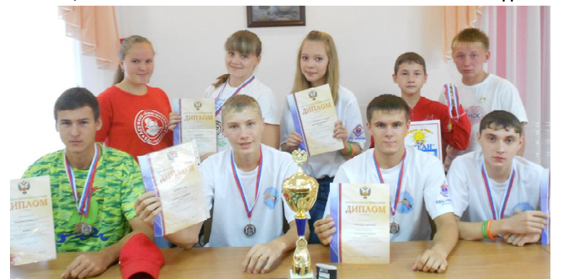
Группа ребят, отдохнувших в ВДЦ «Океан» и «Орленок»