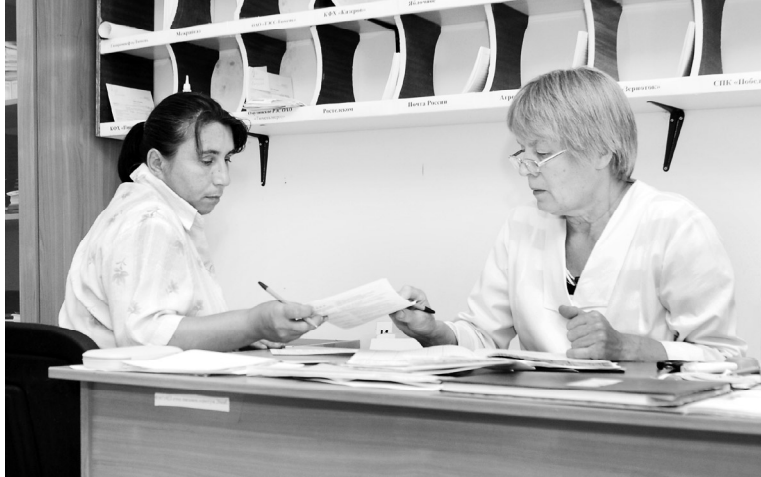
В кабинете профилактики

Ни для кого не секрет, что любое заболевание легче поддается лечению на ранней стадии. Своевременное выявление недуга или риска его развития в ходе регулярного профилактического осмотра помогает избежать серьезных осложнений, а зачастую и спасти жизнь пациента.