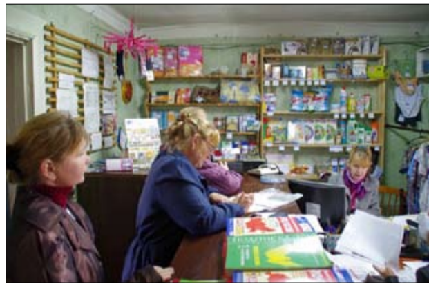
Современное отделение почтовой связи

С прошлого года на страницах газеты обсуждают судьбу сельских почтовых отделений. Они убыточны, и руководство Почты России не заинтересовано в том, чтобы держать их на балансе, поэтому сокращает штат и уменьшает заработную плату сельским почтовикам. Получается, считать убытки у нас умеют, а вот думать о людях пока не научились. Именно эту тему затронула в своём письме наша читательница из Дегтярёво.