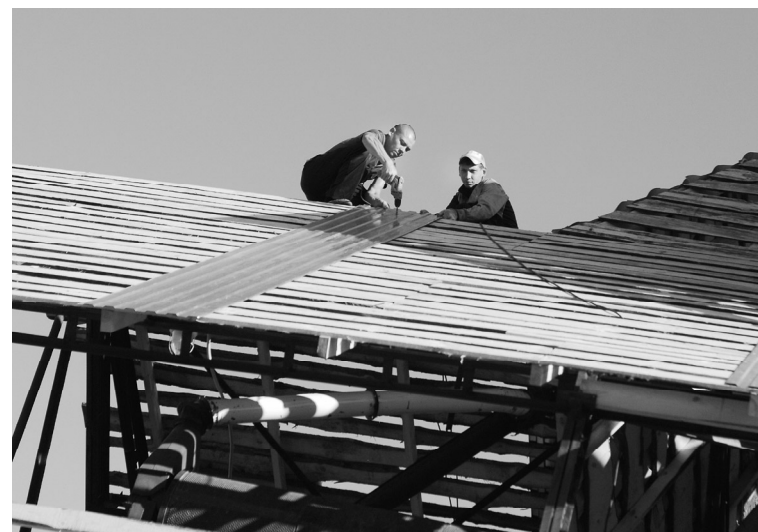
Комплекс будет под общей крышей