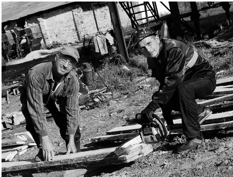
Кипит работа на объекте