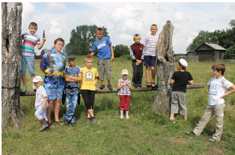
Встретились деревенские мальчишки с городскими