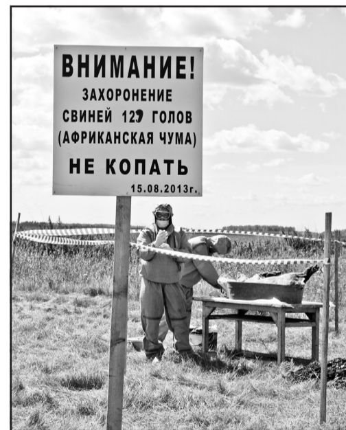
На этом месте брали пробы – патологический материал

вать защитные халаты и бахилы, проходить дезинфекционный барьер. А на личном подворье уже работали ликвидаторы – грузили трупы животных на автомобиль, который затем отправился к месту работы крематория по сжиганию трупов животных. На подворье тем временем проводилась дезактивация территории. С любопытством наблюдали за происходящим соседи на лавочке. Для них это была всего лишь игра. И они не знают, что случись это на самом деле, по населённому пункту давно бы уже ходили переписчики животных, что всех животных необходимо было бы ликвидировать. А это более 750 голов. И ликвидации подлежало бы свиноголовые не только села Гагарья, но и ещё восьми населённых пунктов, находящихся в двадцатикилометровой зоне отчуждения. И что вся территория поселения должна быть взята под особый контроль и объявлена карантинной зоной. И что все эти запретительные мероприятия должны выполняться организовано и чётко представителями местной власти и силовыми структурами. По-другому нельзя. И всё это, пусть с некоторыми условностями, было продемонстрировано во время учений. По-настоящему работал крематорий, по-настоящему обрабаты-