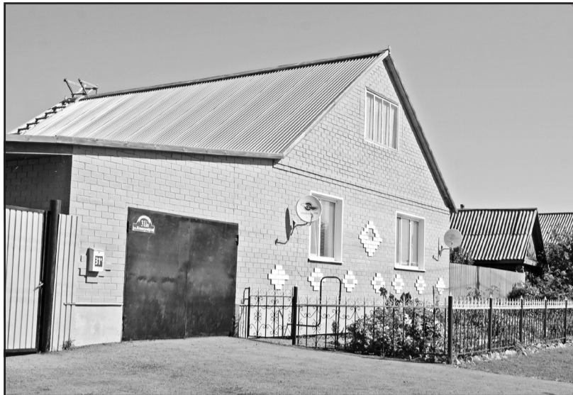
Вот такие дома есть в Заречке