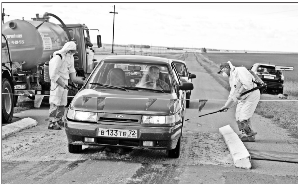
Обработка автомобилей проводилась в обязательном порядке

Именно с этого момента и начались учения по ликвидации очага эпидемии африканской чумы на территории Гагарьевского сельского поселения. Учения были масштабными. На них пригласили главных ветери-