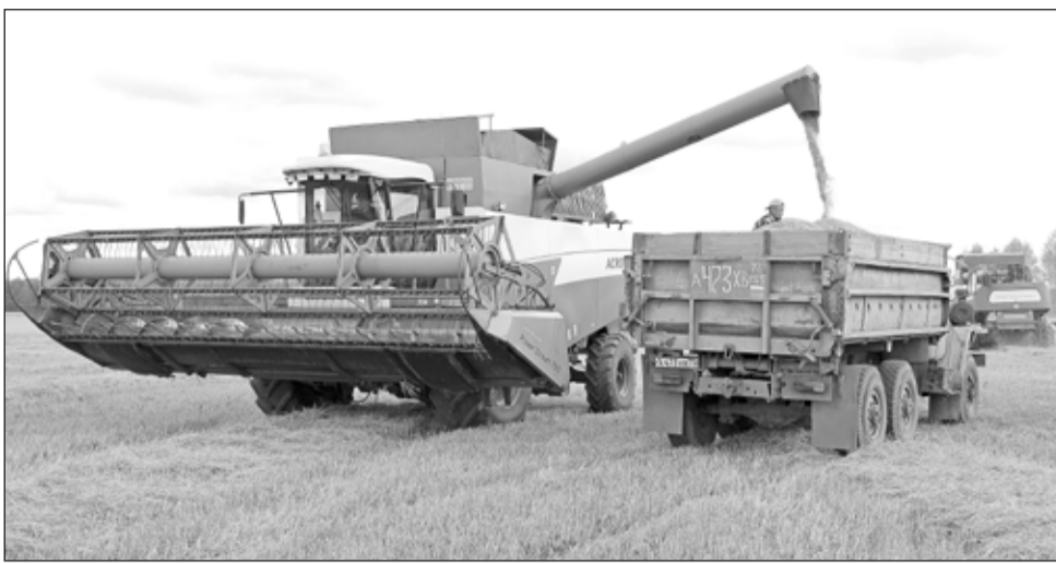
На полях хозяйства Ж.К.Исмакова