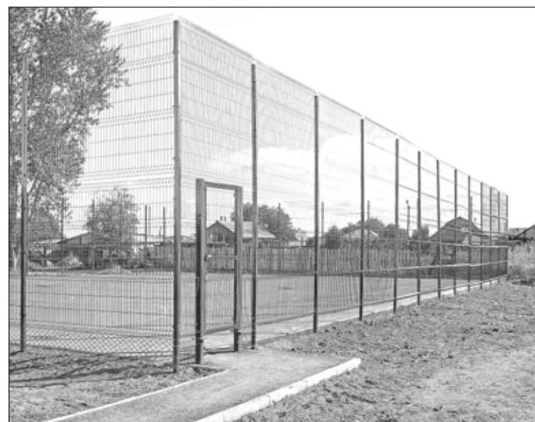
Спортивная площадка у школы №4

Надежда ЧЕРЕПАНОВА.