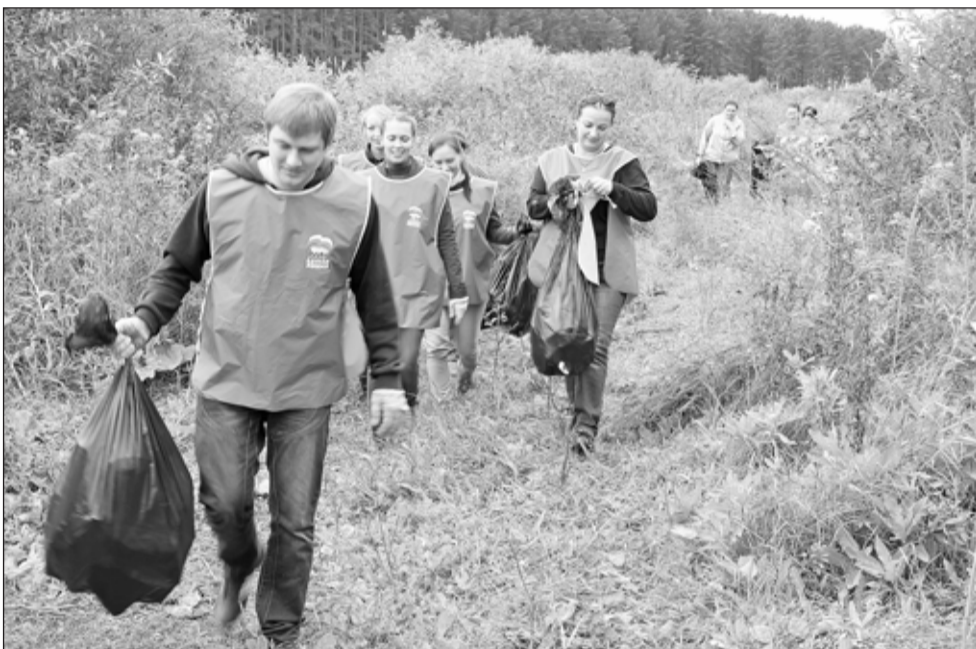
«Десант» администрации в «Сосновом бору»

Предложение отправиться на субботник во второй половине дня в пятницу в нашем журналистском коллективе встретили по-разному. Большинство восприняли это как возможность не только поработать на благо природы, но и отдохнуть от рутинных будней, пообщаться в неформальной обстановке. В результате десять добровольцев после обеда в полном обмундировании отправились наводить порядок на озере Белом. Озеро всегда было любимым местом отдыха. Увиденное нами по приезду заставило ужаснуться. С дороги ничего не видно, но стоит подойти поближе... Пластиковые и стеклянные бутылки, пакеты, пачки из-под сока – всё это «добро» покоится в кустах не первый день, мы их буквально выколуывали из-под травы и песка. Природа кричит о помощи, озеро очень обмелело. Там, где раньше была глубина, сейчас только белый песок, в центре образовался остров из водорослей, а ведь были времена, когда озеро славилось своей чистотой и там даже хотели разводить карпов.