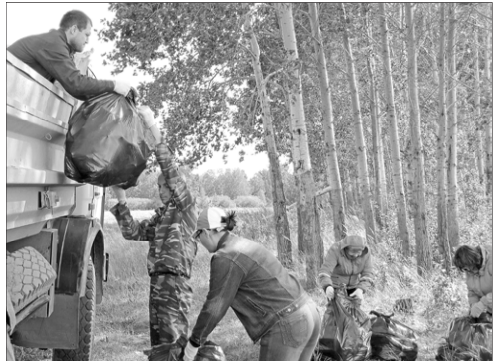
Сделаем Белое – чистым