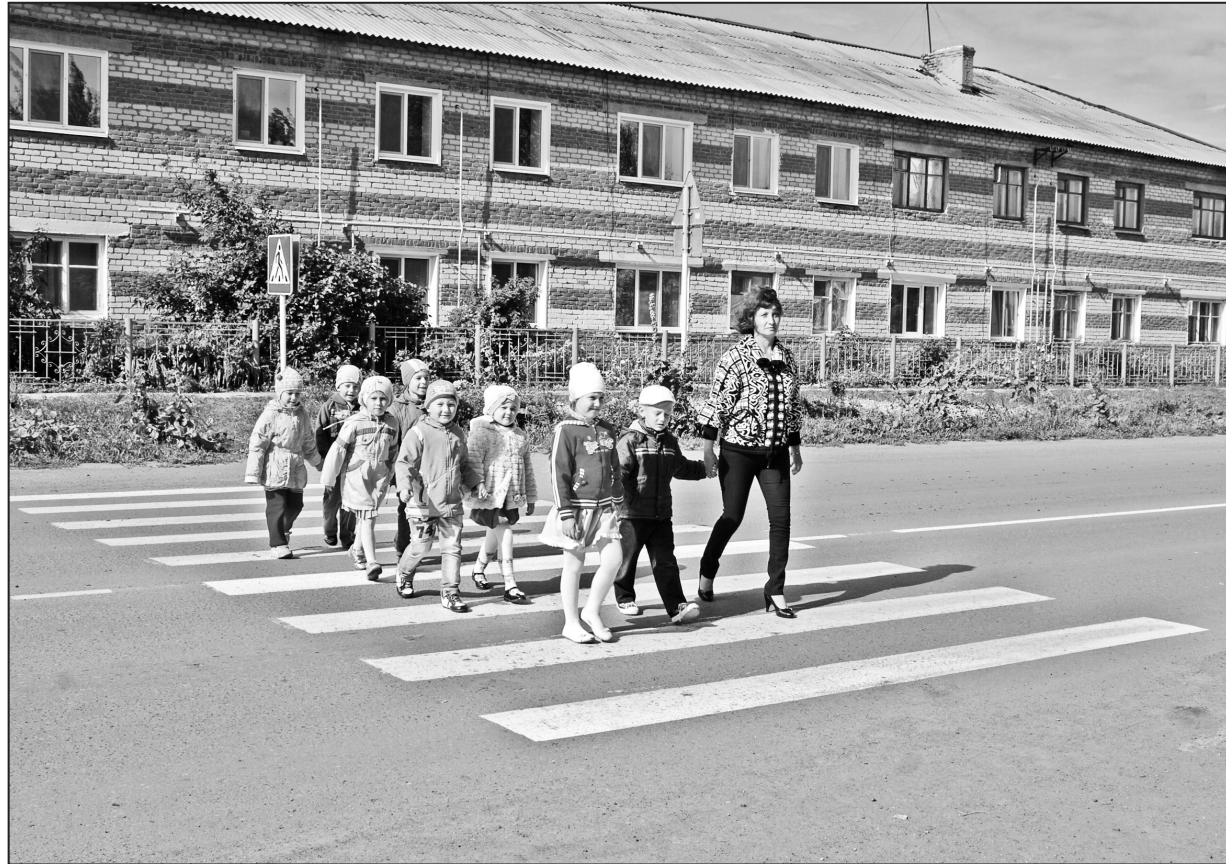
Учимся переходить дорогу правильно