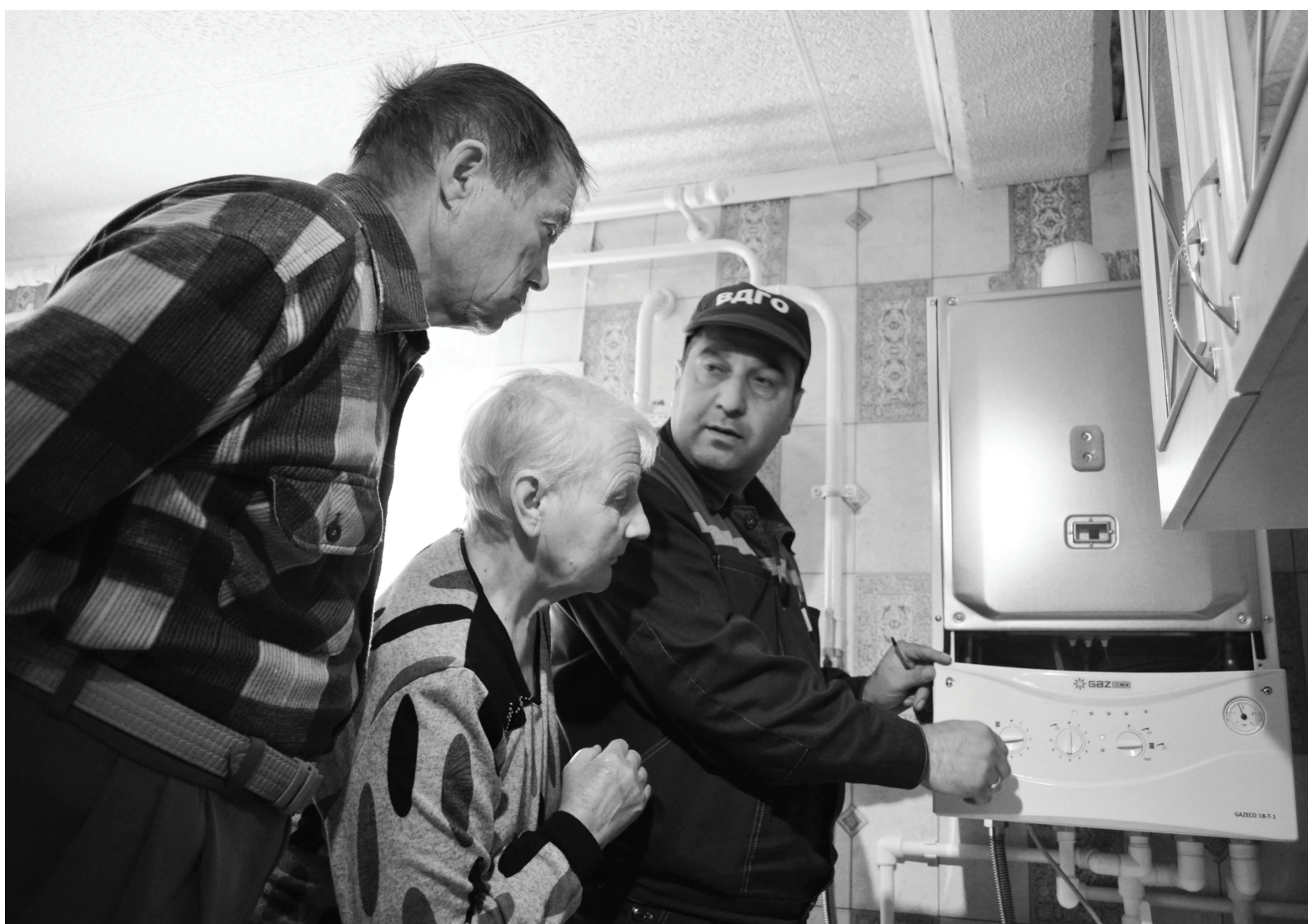
Дело вроде и не хитрое, знакомое - управляться с газовой плитой, но безопасность использования природного газа имеет некоторые специфические нюансы, поэтому и такое внимание к инструктажу.