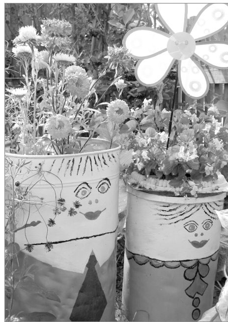
Сударь и сударыня встречают гостей у ворот

по листочку смородины, малины, земляники, мяты, мелиссы, календулы, одуванчика, петрушки и даже мокрицу... В общем, пригодится всё, что растёт в огороде. Просто завариваем в чашку и добавляем ложечку варенья или мёда. Употребляя такой напиток ежедневно, вы насытите свой организм витаминами, повысите иммунитет, зарядитесь на зиму энергией, - советует она.