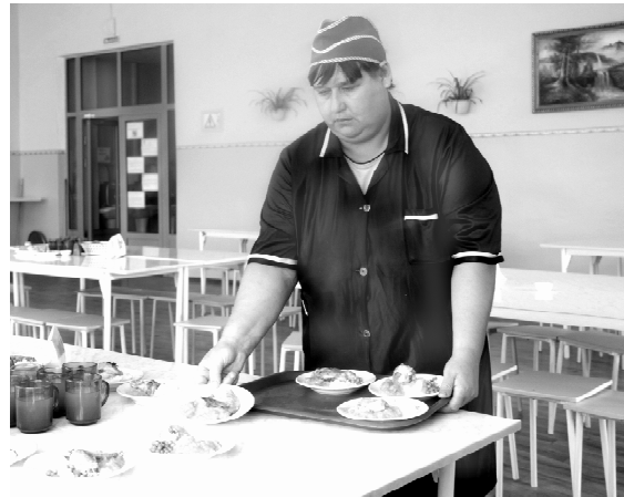
* Сервировка столов