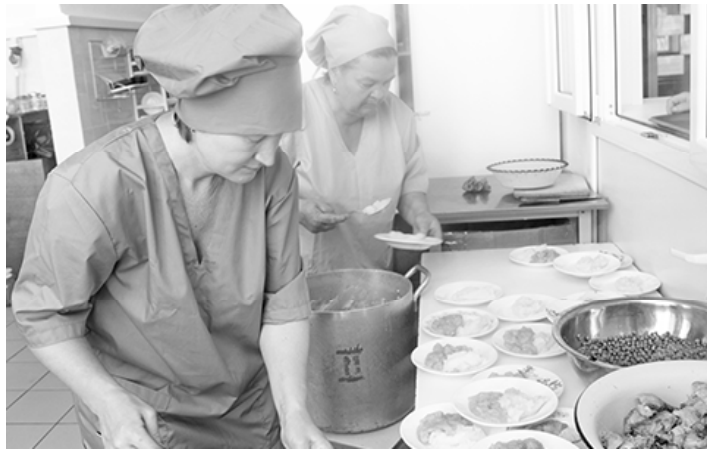
* Готовимся к обеду

Организация горячих обедов в образовательных учреждениях – вопрос важный. Здоровью детей в последнее время уделяется особое внимание. В первый день занятий мы побывали в Маслянской средней школе, где нам рассказали о том, как здесь решены вопросы питания.