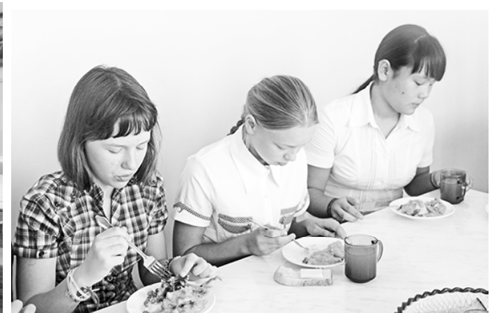
* Приятного аппетита, ребяты!

Повсеместно в школах во время летних каникул дети занимаются социально значимой деятельностью, а проще говоря, обыкновенной «отработкой» на пришкольном участке. Ребятишки высаживают овощную рассаду, ухаживают за ней, поливают, вырывают сорняки.