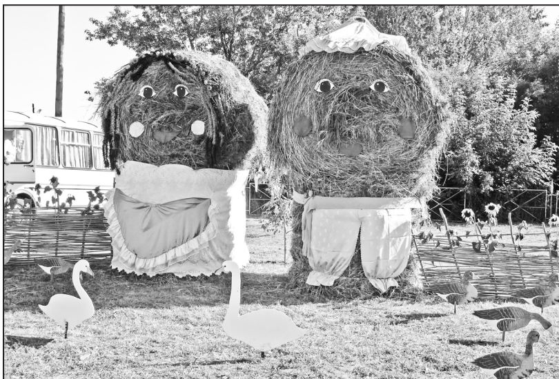
Вот такие необычные хозяйка с хозяином встречали в этот день гостей праздника

ностью и большим огородом — заслуживает такого к себе внимания и имеет право на отдых.