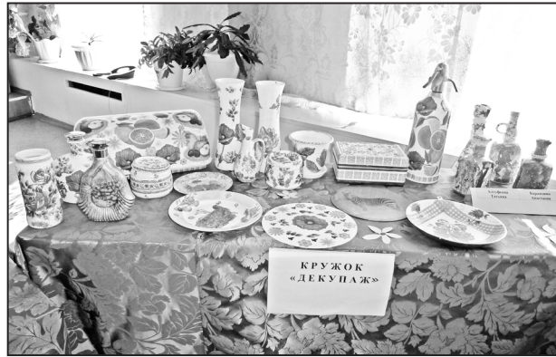
Много интересных и оригинальных экспонатов представлено на выставке работ народных умельцев. Здесь были и частные коллекции, и коллективные произведения