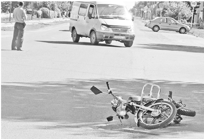
* Когда «игрушка» привела к беде...

В большинстве случаев эти молодые люди (1987, 1990, 1991, 1993, 1994 годов рождения) находились в состоянии алкогольного опьянения. Один из них до этого уже был лишён прав за вождение в нетрезвом виде. Аварии произошли как в черте населённого пункта, так и на автодорогах.