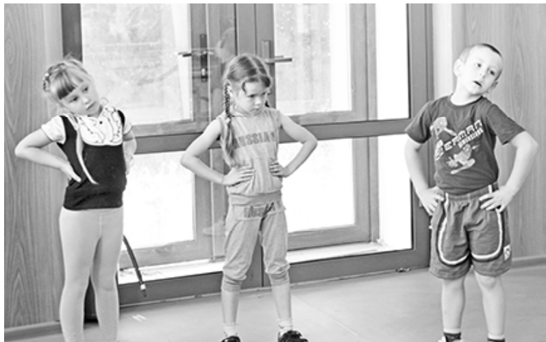
* На зарядку становись!