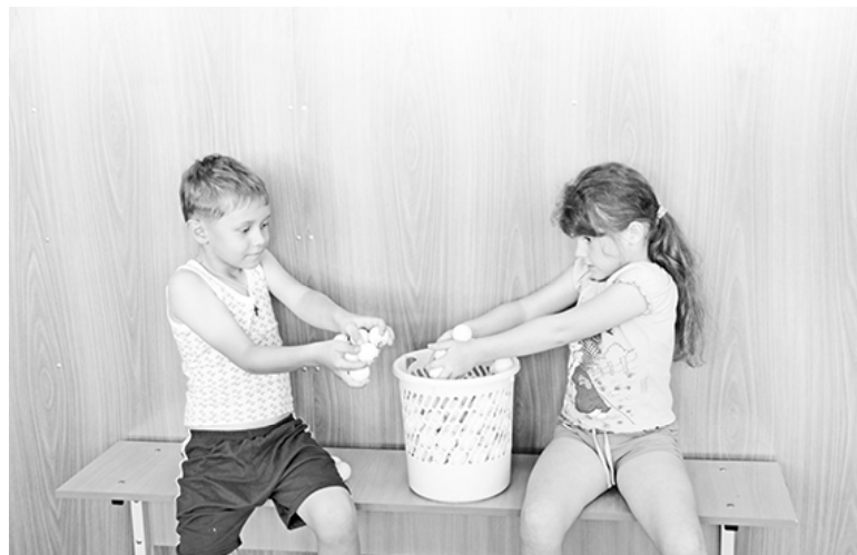
* Игра с шариками

Материалы полосы к печати подготовила Елена ДАНИЛЬЧЕНКО.