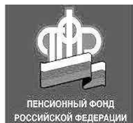
ПЕНСИОННЫЙ ФОНД РОССИЙСКОЙ ФЕДЕРАЦИИ

Необходимо обратить внимание, что годовые взносы участника в размере менее 2 000 руб-