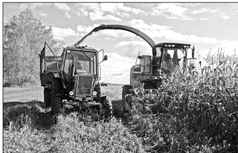
Шесть транспортных единиц едва-едва успевают за этим комбайном