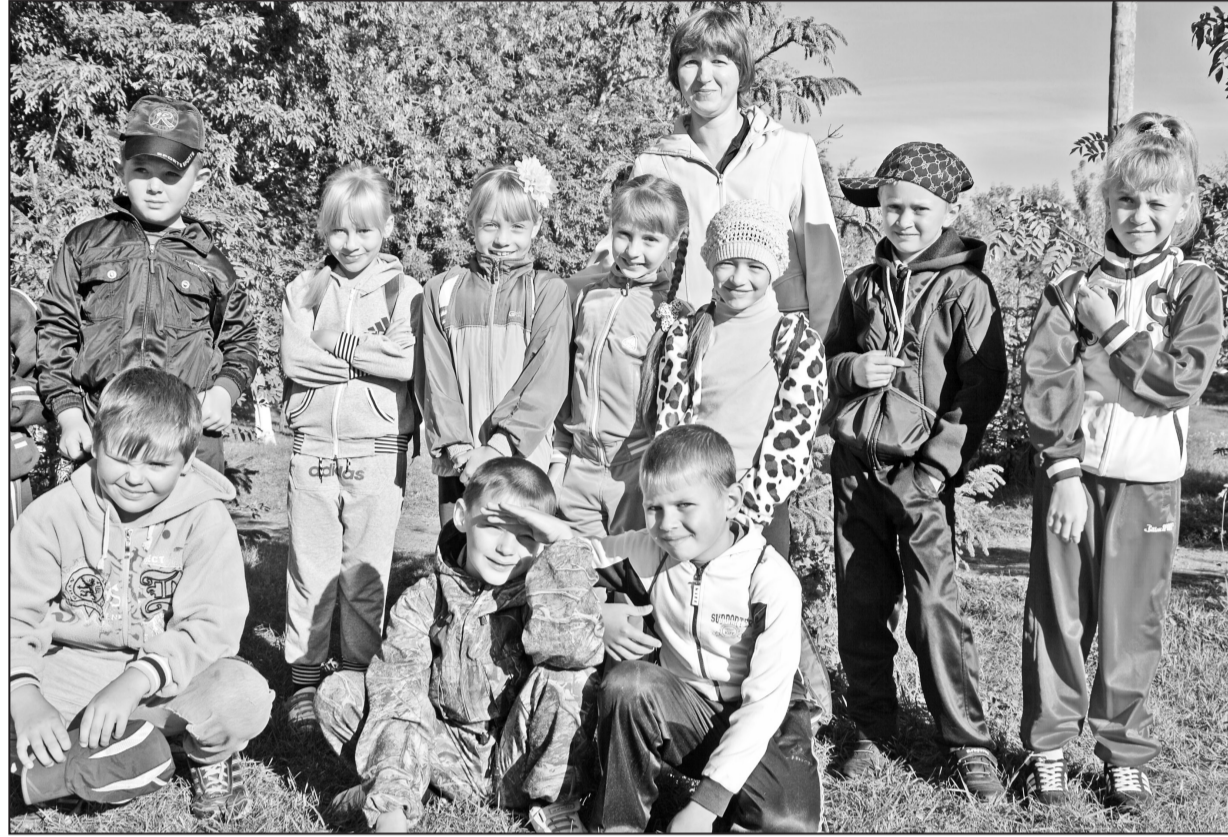
Учащиеся младших классов Новоселёвской школы с удовольствием принимают участие в Дне здоровья

На календаре – первый месяц учебного года – сентябрь. Время адаптации после беззаботных каникул, впечатления от которых ещё так свежи. Своими воспоминаниями о лете сегодня с читателями «Ребятчье республики» делятся учащиеся Новоселёвской школы.