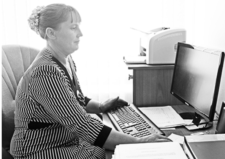
* Работа в электронном журнале

– Согласна с коллегой полностью! Времени на ведение электронного журнала уходит