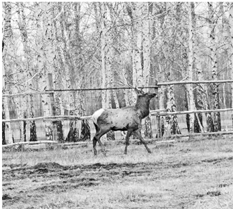
* Марал в лесу