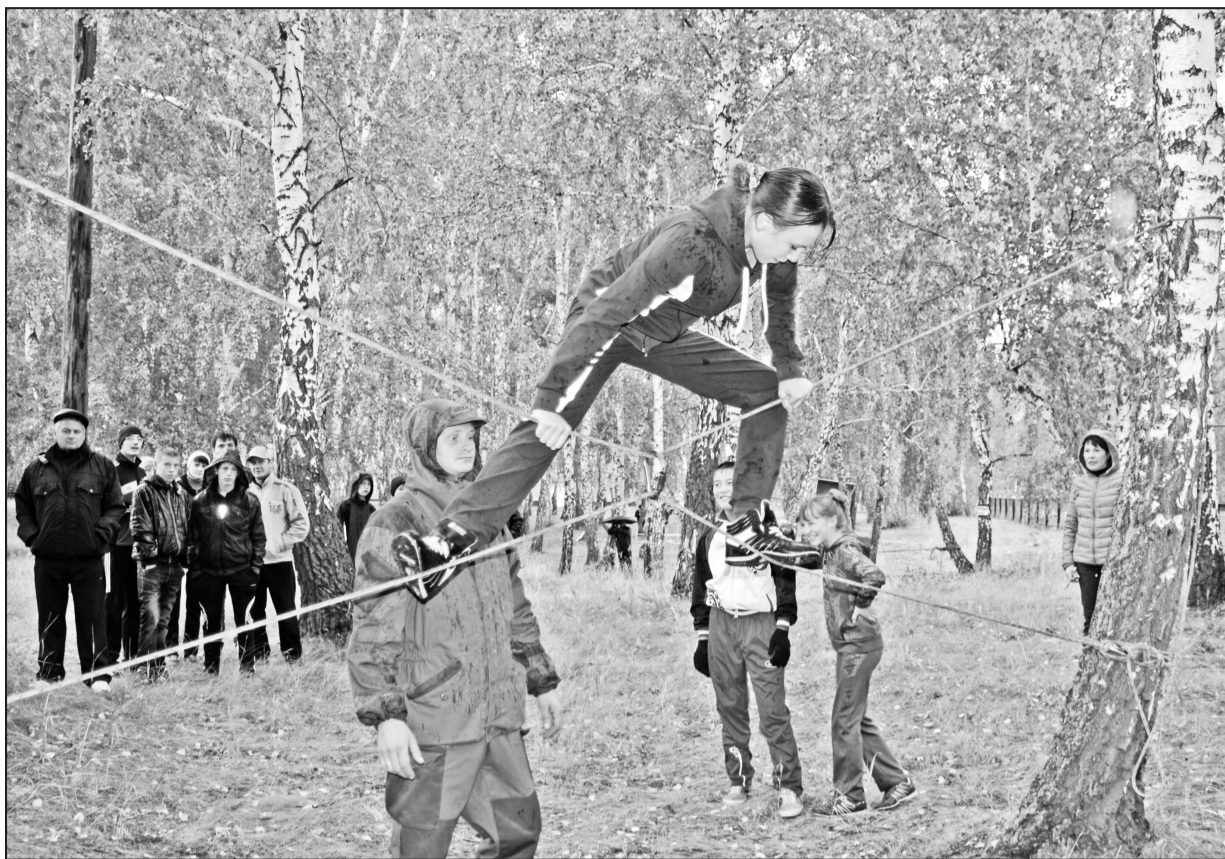
Первыми преодолевали препятствие туристы из Челюскинской средней школы