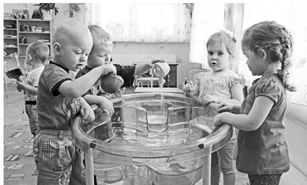
* «Наш любимый аквариум»