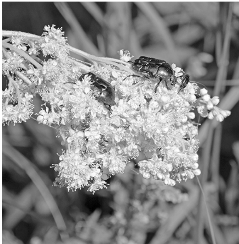
* На лесной поляне

Ритуальные услуги (по Сладкову и Сладковскому району). Обр.: т. 8 9224841003.