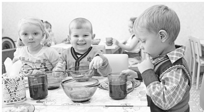
* «Мы кушаем!»