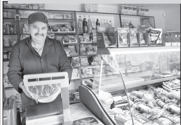
«Мясная лавка» В.Н. Иневаткина

Подготовила Т. УСОЛЬЦЕВА