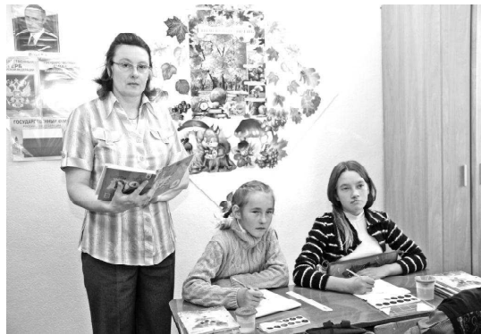
«Пока земля кружится во Вселенной, Профессия учителя нетленна!»