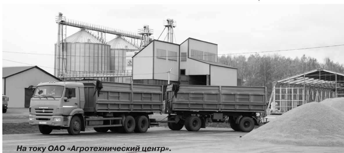
На току ОАО «Агротехнический центр».