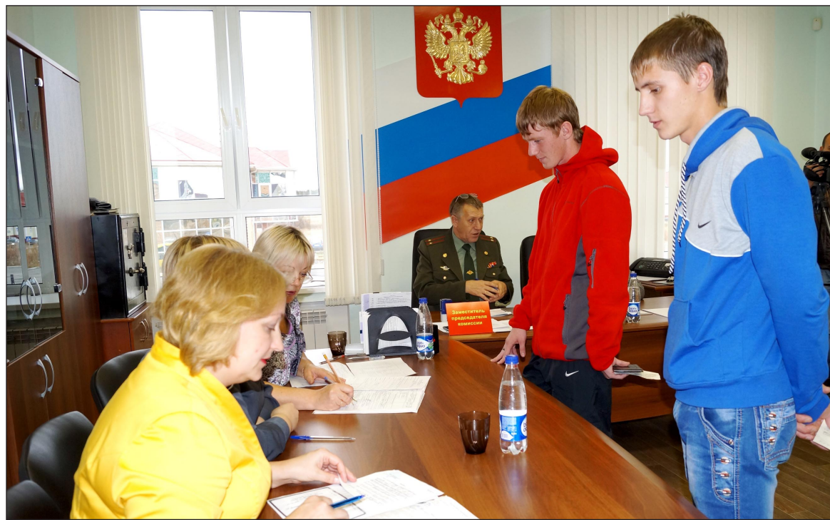
Молодёжь Уватского района идёт на воинскую службу с желанием.